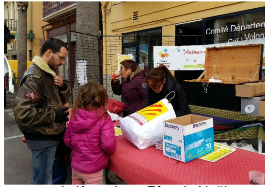
9 décembre : Fête de Noël