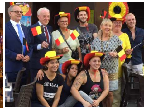
21 juillet : Fête nationale belge