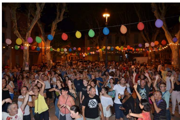
7 juillet : Bal populaire