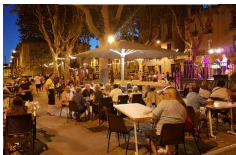
14 juillet : Fête nationale