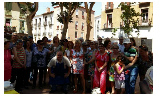
10 juin : repas de l'asso