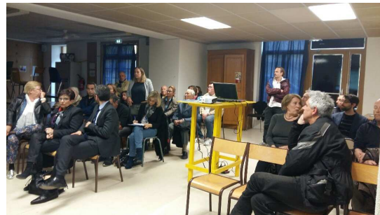
27 avril : la MQO organise une réunion sur la PNRQAD