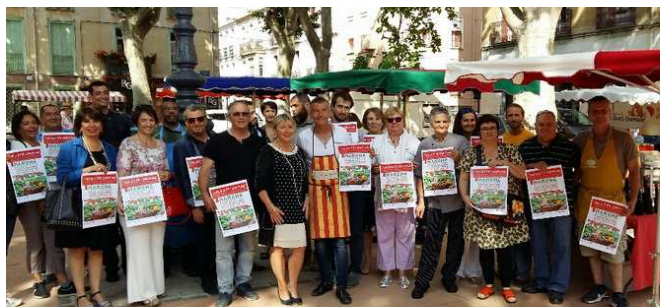
25 mai : les 2 ans du marché