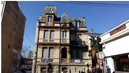
3 avril : l'association visite la maison Combes- Jacomet