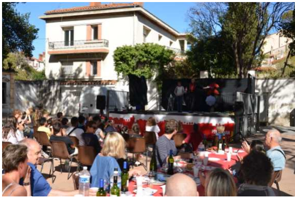
7 octobre : Fête des quartiers