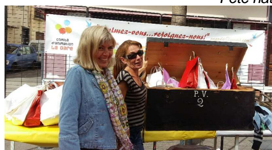
15 septembre : Chasse au trésor