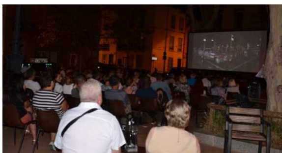
28 juillet : Cinéma de plein air