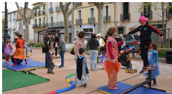
1er avril : Carnaval des enfants