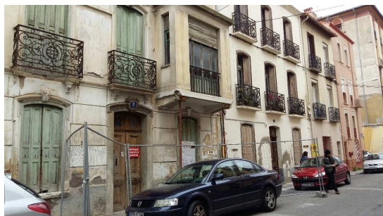
Immeuble en péril, rue du Progrès