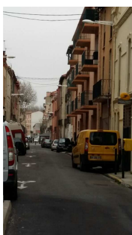
Rue V. Hugo