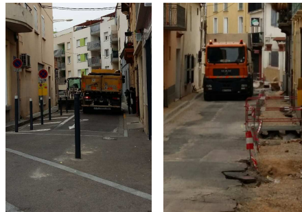
Travaux en cours

Réunion d'information concernant les travaux rue Châteaubriand et Boileau. Peu de riverains avaient fait le déplacement salle Bolte.