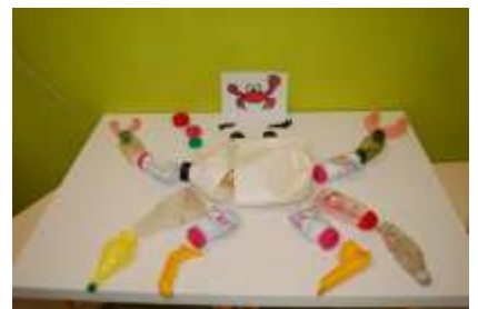
Exemple des créations préliminaires des enfants