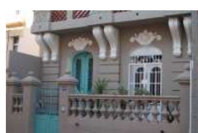
Edition de la Charte Façades Patrimoine