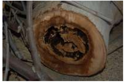
Abattage platane malade Place Belgique