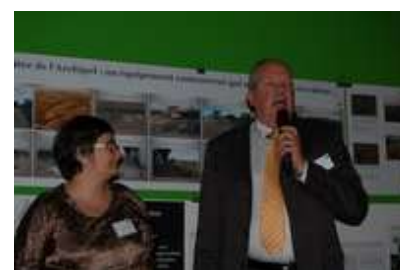
Atelier d'Urbanisme 16 novembre