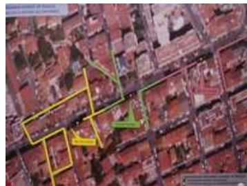
Mise en place des containers enterrés av. de Gaulle