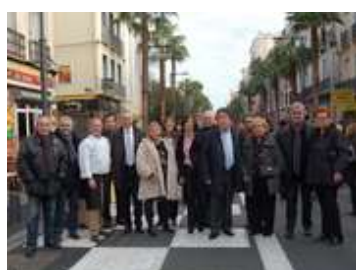
Le Grenier du Père Noël 15 décembre