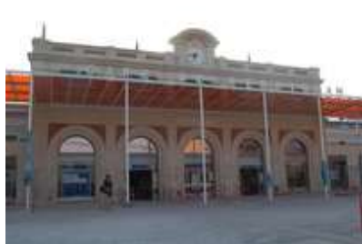
Travaux parvis Gare SNCF