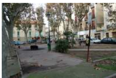
Commission de travail Place de Belgique