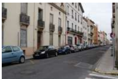
La rue Courteline va devenir un sens unique dans le sens de Gaule Avenue Ribère. Une enquête de proximité va être faite. (Les travaux seraient prévus aux vacances de Pâques)

L'assemblée a approuvé à l'unanimité l'augmentation de la cotisation à 15 € à partir de 2014.