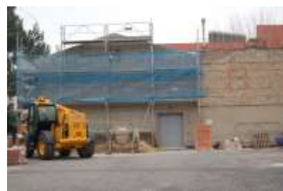
Travaux Salle Bolte