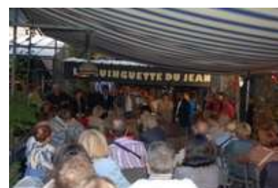
Rencontre citoyenne 19 septembre