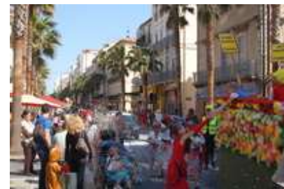
1 er avril Carnaval