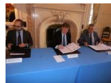
Signature convention PNRQAD à la Préfecture, le 19 sept.