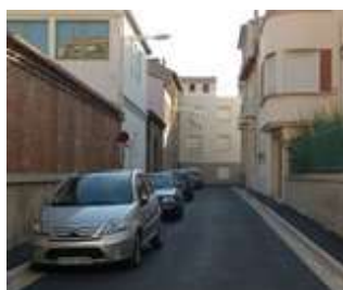
Fin des travaux rue Marguerite