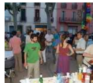
Fête des Voisins 1 er juin