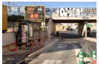
Travaux angle av. Grande-Bretagne et Bd du Conflent