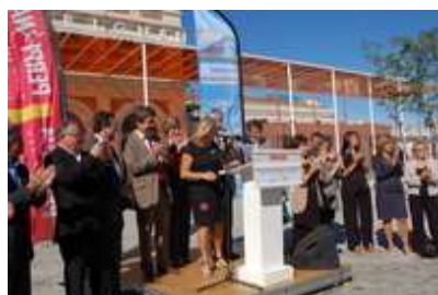
Inauguration av. de Gaulle 15 septembre