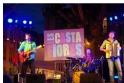
Bal populaire 6 juillet Place Belgique