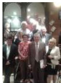
Réunion avec M. Le Maire le 4 juin