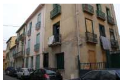
Mise en place ORI îlot Hugo Marceau