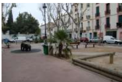
Fin du projet d'aménagement de la place de Belgique