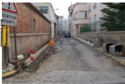
Travaux impasse Marguerite