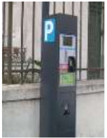
Mise en place des horodateurs dans le quartier

Le rapport moral, bilan d'une année dans le quartier s'est fait en images.