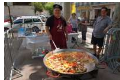
Réunion Repas le 16 juin Place Belgique