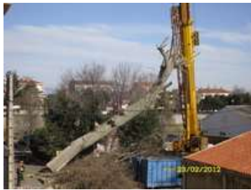
Abattage platane malade rue Claude Marty