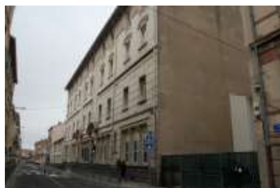
Restructuration de l'école J-J Rousseau