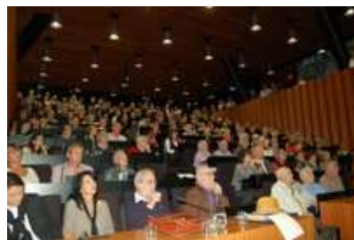
Présentation du PNRQAD 1 er octobre