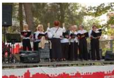
Fête des quartiers Parc Pépinière, 6 octobre