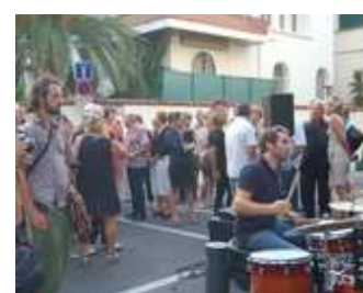
Visa Off Inauguration le 5 sept.