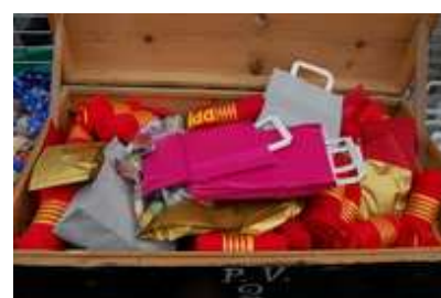
La Chasse au trésor