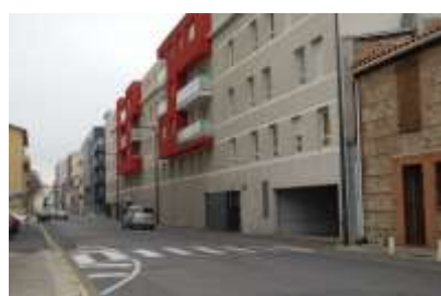
Travaux av. de Grande-Bretagne Bus Tram