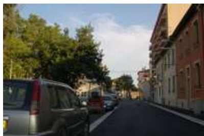
Fin des travaux rue Claude Marty