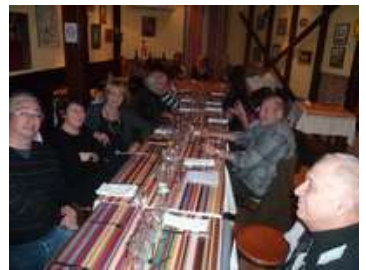
Réunion des associations le 20 janvier