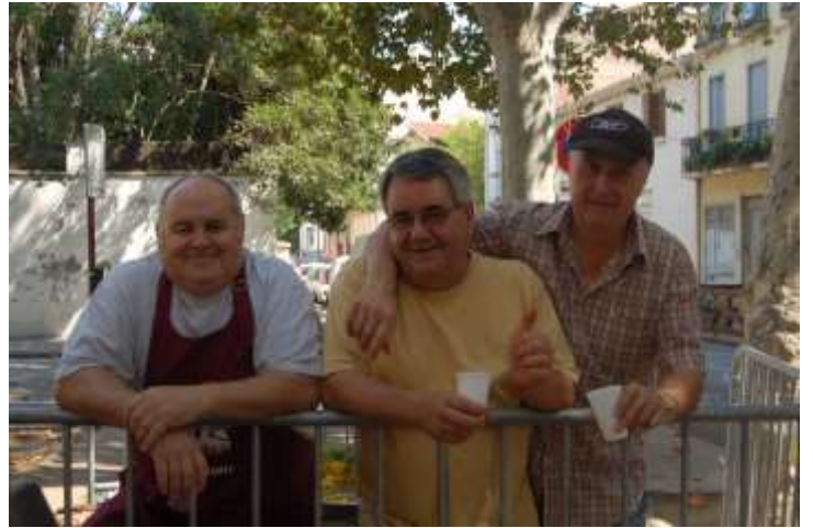
Merci aux cuisiniers