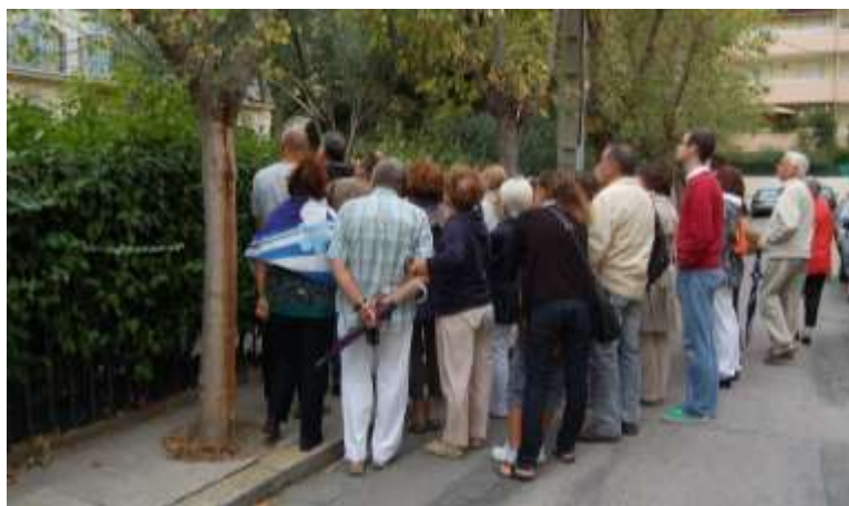
Ici, découverte des Villas Amiel

Les 17 et 18 septembre ont eu lieu les journées européennes du Patrimoine. Nombreux étaient ceux qui ont fait la visite de notre quartier Gare pour y découvrir tous ses petits secrets.