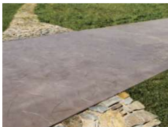
Site de Paulilles