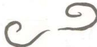
Exemple : La Moustache de Dali