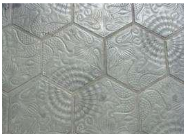
Trottoirs de Barcelone